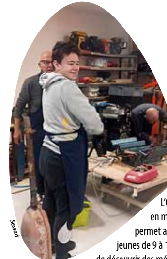
L'Outil en main permet aux jeunes de 9 à 14 ans de découvrir des métiers auprès d'anciens professionnels. Il reste des places cette année!

reste des places parce qu'il y a trois bénévoles en plus cette année. Nous avons 25 places contre 20 l'année dernière.