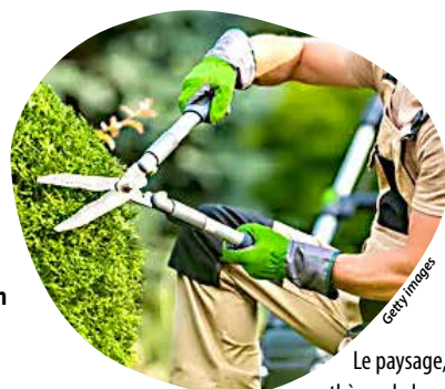
Le paysage, thème de la prochaine matinée.

En effet, ce secteur recrute pour mener à bien ses productions végétales et suivis d'élevage. C'est pourquoi les matinées Agri'mouv sont organisées pour faire connaître les métiers qui embauchent et qui forment, afin de donner envie au public de s'orienter ou de se reconverter dans cette voie. Ces temps forts offrent également l'opportunité de découvrir plusieurs environnements de travail du secteur agricole mais aussi d'échanger avec des conseillers emplois, des formateurs, des salariés ainsi que des chefs d'entreprises agricoles. L'an passé, sur les 246 participants inscrits aux différentes dates, 40