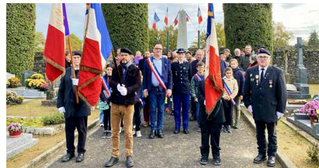
Mairie de Vezins