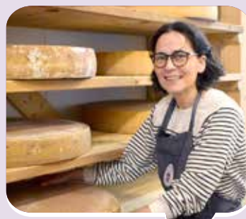
« Prendre soin des fromages... et des clients ! »

S. h. : quel cursus faut-il suivre pour devenir fromager-affineur ? S. C. : il existe un CAP crémier-fromager et des formations complémentaires pour être affineur, notamment dans l'est de la France. Mais c'est aussi un métier qui peut s'apprendre sur le tas, au contact de professionnels qui aiment transmettre leur savoir. Ce fut mon cas, pendant sept ans, auprès d'un fromager-affineur de Savoie qui m'a confié tous ses secrets, d'abord dans une petite boutique, puis sur les marchés, avant de m'enseigner les techniques d'affinage. Aujourd'hui encore, je continue à me former et piocher des conseils dans les ouvrages spécialisés. On n'a jamais fini d'apprendre !