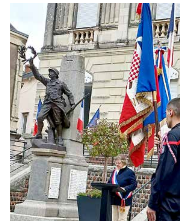
Mairie de Lys-Haut-Layon-Vihiers