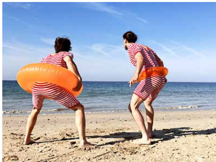
Un spectacle gonflé qui ne manque pas d'air!