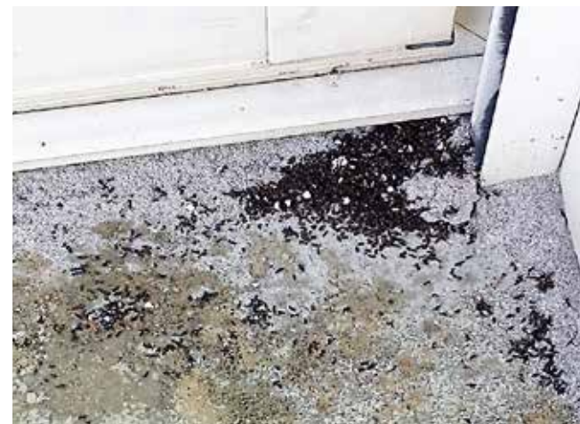
Il est nécessaire d'agir au plus vite, et de façon collective, en cas d'invasion de fourmis.

Au niveau de l'environnement, les fourmis concurrencent la faune locale, conduisant de ce fait à une diminution de la biodiversité. Elles occasionnent également des dégâts agricoles et peuvent commettre des dommages sur les infrastructures. Et bien sûr, elles provoquent des nuisances dans les jardins et les maisons et dégradent la qualité de vie des habitants. « La fatigue psychologique qu'elles provoquent est d'ailleurs le premier impact formulé. Attirées par tout ce qui est électrique et électronique, elles grignotent les fils et gaines, pénétrant dans les différents appareils. Elles vont même jusqu'à entrer dans les frigos. Peu d'insecticides fonctionnent et il est quasi impossible de s'en débarrasser si l'on n'est pas bien informé. » C'est pourquoi en cas d'invasion, il convient d'écraser quelques fourmis avec votre doigt. Si une odeur de