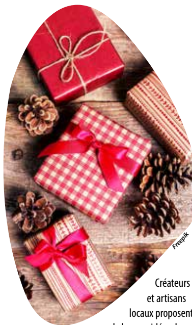
Créateurs et artisans locaux proposent de bonnes idées de cadeaux pour Noël !

graphiques, ateliers de modelage de petits animaux mignons, - le Génie club : broderie et couronne de fleurs séchées brodées, ateliers de couronnes de fleurs séchées et de broderie pour customiser ses vêtements, - Mmhh Production : bouquets de fleurs séchées issues de sa culture, - Tartoche : accessoires textiles graphiques, - L'Arbre indigo : créations textiles éco-responsables, - la Boutchique : friperie, - l'Atelier d'Éloïse : maroquinerie, accessoires en cuir (sacs, ceintures, portefeuilles...), - les Savons de Léandra : savons bio, - Kanopee design : mobilier et luminaires contemporains, - Marie-Thérèse, tisseuse de lettres : calligraphie et art textiles, - Bonjour vous studio : illustrations. Enfin, trois tatoueuses organiseront aussi leurs rendez-vous dans une salle qui leur est réservée.