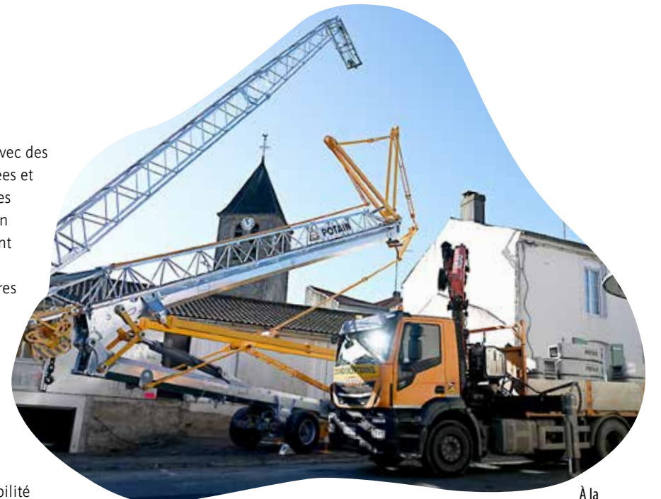
À la mi-novembre, la grue de chantier était installée côté rue du Commerce.

et un psychologue, avec des salles d'attente dédiées et un secrétariat pour les médecins. L'extension à l'arrière du bâtiment abritera un espace d'accueil, des vestiaires et une zone de détente. Des entrées sont prévues de chaque côté du bâtiment, dont une, côté rue de l'Hôtel-de-Ville, donnant accès aux personnes à mobilité réduite. La structure, qui se veut économique en énergie, sera équipée d'une isolation supplémentaire par le sol et de panneaux photovoltaïques. Si les sept cabinets répondent aux demandes des professionnels s'installant prochainement dans cette maison de santé, de nouveaux praticiens souhaitant les rejoindre