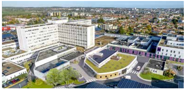
Les nouvelles urgences, en bas au centre, ouvriront d'ici deux à trois ans.

« Comme chacun le comprendra, cet important chantier prenant place dans une zone de passage fréquentée de l'établissement, des désagréments seront malheureusement à prévoir pour les mois à venir, prévient la direction. Nous prions donc les usagers de bien vouloir excuser les gênes occasionnées par les travaux : bruit, stationnement compliqué et accès difficile à certains services. » Les