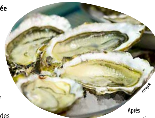
Après consommation, les coquilles d'huîtres et de crustacés peuvent être déposées en déchèterie.

Les fêtes de fin d'année sont une période où la consommation d'huîtres et de crustacés est importante. Cholet Agglomération invite les habitants à venir déposer leurs coquillages dans toutes les déchèteries et éco-points du territoire où des contenants sont mis à disposition de ce dimanche 1 er décembre au vendredi 31 janvier. Les usagers qui le souhaitent pourront se stationner à l'extérieur de la déchèterie et apporter à pied leurs coquillages. Aucun passage ne sera décompté de leur carte d'accès (sauf s'ils déposent autre chose). Les coquillages collectés seront recyclés par des partenaires spécialisés et pourront être transformés de façon à enrichir les sols agricoles par exemple.