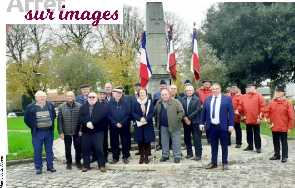
Mairie de La Plaine