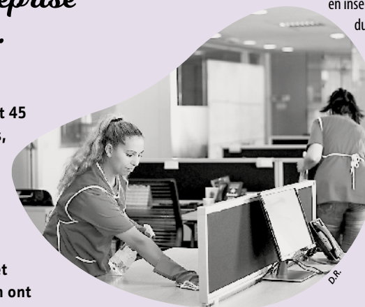
Les salariées de Sygma, qu'ils soient en insertion ou non, effectuent du nettoyage industriel.