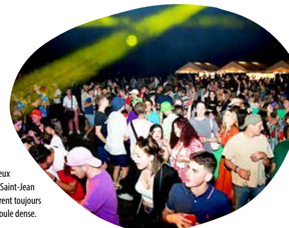
Les Feux de la Saint-Jean génèrent toujours une foule dense.