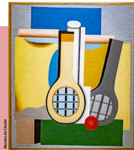
Musée de Cholet

Découvrons Les trois raquettes , de Marcelle Cahn. L'artiste (1895-1981) est née à Strasbourg dans une famille de banquiers et de commerçants mélomanes et cultivés. Elle étudie la littérature et la philosophie à l'université de Strasbourg, tout en dessinant en parallèle. En 1915, elle s'installe à Berlin et débute la peinture. Elle revient en France après la Première Guerre mondiale et commence à fréquenter les académies parisiennes au début des années 1920, notamment l'Académie moderne. Cette école d'art libre