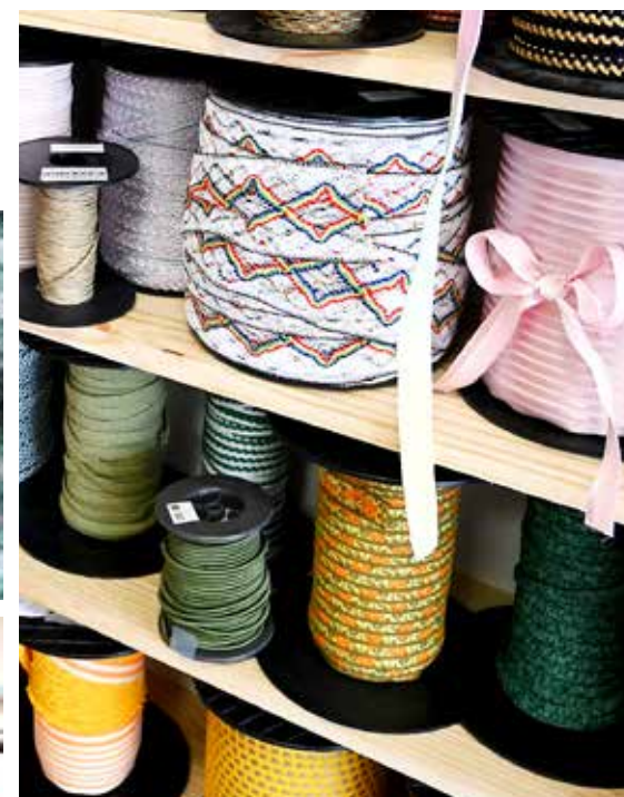
Au lieu d'être jetés, les reliquats de production sont réutilisés ou proposés à la mercerie.

réflexion pour utiliser les bobines, jetées par manque de places. C'est à la suite de ce questionnement que le projet de tiers-lieu, nommé la Manufacture de Tressage, a vu le jour, concrétisé... dans l'ancienne usine de SCF, à Bégrolles-en-Mauges !