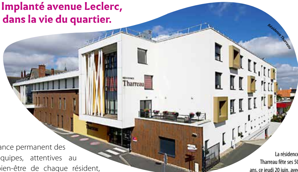
La résidence Tharreau fête ses 50 ans, ce jeudi 20 juin, avec un temps officiel, suivi d'un repas festif ouvert aux proches, puis d'animations ludiques et musicales.

- le pôle hôtelier, avec des agents dédiés au service des repas, à l'entretien des locaux et du linge, - le pôle soins, avec des infirmières présentes 7 j/7, des aides-soignants, une cadre et un médecin télécoordinateur qui s'assure de la qualité des soins à distance, - le pôle vie sociale avec un psychologue, une animatrice et deux aides médico-psychologiques, - et le pôle administratif. Tous dévouent leurs journées aux 94 résidents accueillis: 83 en hébergement « à durée indéterminée » et 11 en hébergement temporaire pour une sortie d'hospitalisation, un séjour de répit, de découverte ou d'attente d'entrée dans une autre institution.