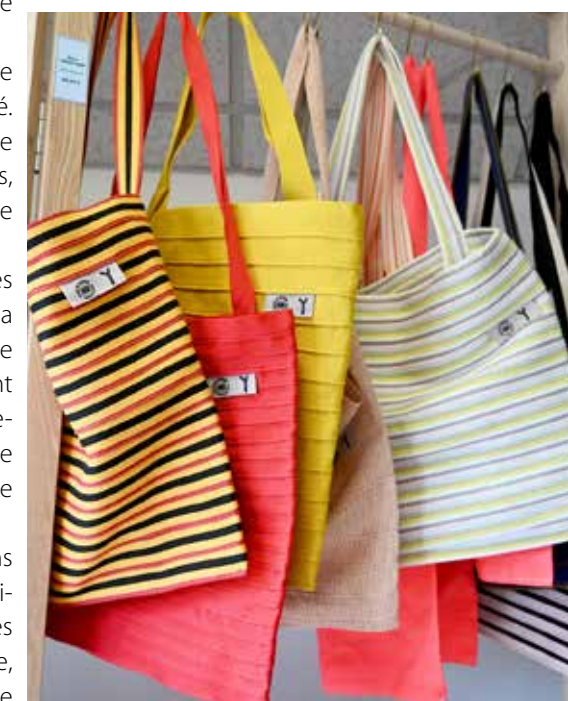
Made by bobine utilise 15 à 20 m de sangle, issus des chutes de production, pour fabriquer des sacs cabas colorés et originaux.

Souhaitant aller plus loin dans cette logique de recyclage, visant à réemployer et valoriser des productions de l'industrie textile, Made by bobine a entamé une