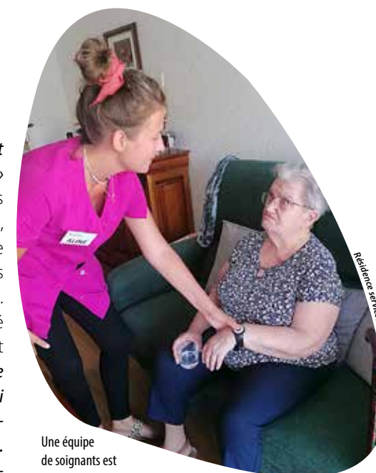
Une équipe de soignants est présente 7 j/7, 24 h/24.

naturellement pour les différents services rendus aux aînés: - la restauration, sachant qu'aucun repas n'est obligatoire, les résidents peuvent manger au restaurant, y compris avec d'éventuels invités, mais aussi se faire livrer les repas ou cuisiner dans leur logement, - l'aide ménagère à la carte, - l'aide et l'assistance avec la présence rassurante et l'oreille attentive d'une infirmière en continu, qui assure la coordination médicale avec les aides-soignants de jour et de nuit, chaque résident étant aussi équipé d'un médaillon d'appel, - les activités (gymnastique douce, sophro-