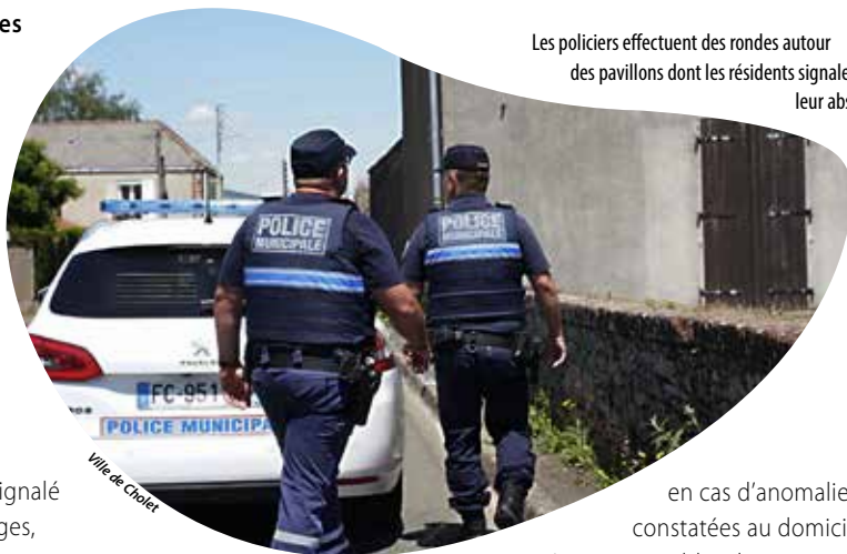
Les policiers effectuent des rondes autour des pavillons dont les r sidents signalent leur absence.

S' chapper du Choletais pour les cong s d' t  sans craindre une visite inopportune de son habitation ? C'est possible avec l'op ration Tranquillit  vacances. Du 1er juillet au 31 ao t, les habitants de Cholet et du Puy-Saint-Bonnet peuvent faire surveiller leur domicile par la Police municipale qui, en collaboration avec la Police nationale, effectue des rondes r guli res autour des pavillons dont les r sidents ont signal  leur absence. Lors de leurs passages, les agents contr lent les ouvertures, les acc s et font  ventuellement le tour du jardin, en accord avec les demandeurs. « En plus d' tre une belle illustration d'un service public qui fonctionne, cette op ration appar it comme une n cessit . En effet, les cambriolages sont plus nombreux l' t  et notre territoire ne d roge pas   la r gle, pr cise Patrice Brault, adjoint au maire de Cholet en charge de la S curit  et de la R glementation. Depuis le lancement en 1997, l'excellent taux de r ussite d montre l'efficacit  de la d marche. »