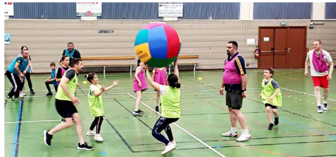
Mairie de Vezins

À l'initiative du conseil municipal des enfants, qui a souhaité organiser une soirée sportive permettant de réunir parents et enfants, la Municipalité a mis en place une action à vivre en binôme. Au programme: course d'orientation, initiation au kin ball, mais aussi badminton ou tennis de table, à jouer avec ou contre son enfant. Après ce temps de partage avec le sport comme support, la soirée s'est clôturée par un temps convivial au cours duquel enfants comme parents ont fait part d'un retour positif pour cette première... qui sera sans aucun doute renouvelée dès la rentrée prochaine!