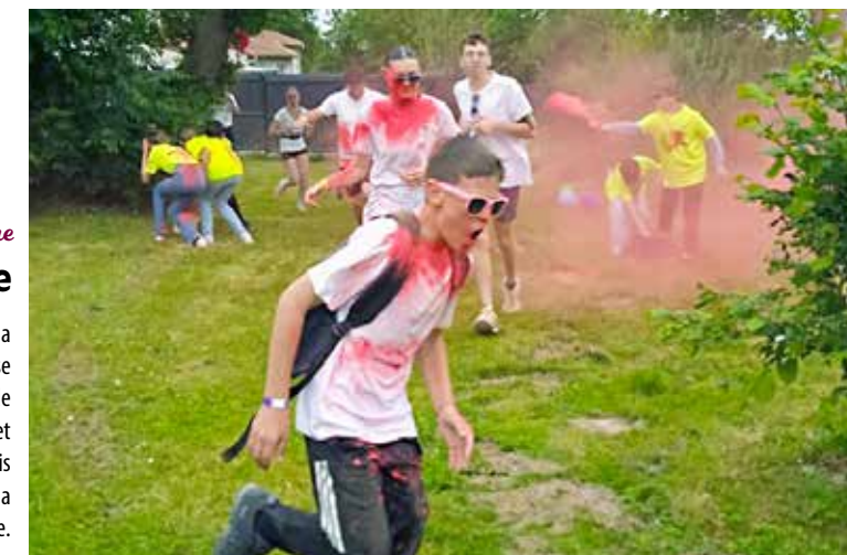
Mairie de La Plaine

C'était jour de fête dans la commune en ce samedi! Fortes de la réussite des éditions précédentes, l'Association festive plainaise et Familles rurales reconduisaient la Run color music, qui a de nouveau rencontré un joli succès. Ce rendez-vous familial et convivial a réuni quelque 500 participants, un record! Une fois couverts de poudres colorées, petits et grands ont profité de la soirée, consacrée à la fête de la musique.