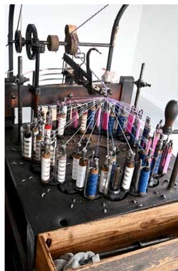
Des formations sont proposées pour faire perdurer le savoir-faire associé à ces métiers à tresser : comment placer les couleurs pour obtenir un motif particulier, le nombre de brins à utiliser, etc.