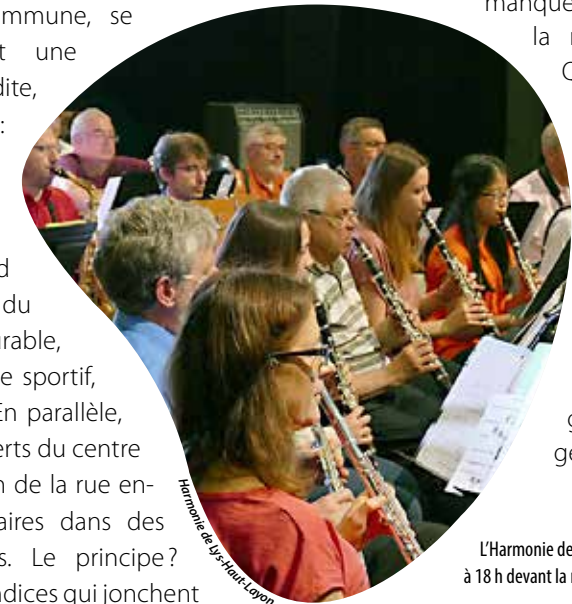
L'Harmonie de Lys-Haut-Layon jouera à 18 h devant la médiathèque.

Point d'entrée de cette journée festive, la musique sera évidemment au cœur de l'événement, avec plusieurs concerts à ne pas manquer jusqu'au bout de la nuit : fanfare Smile Quintet à 16 h 30, 19 h 15 et 21 h 30, Harmonie de Lys-Haut-Layon à 18 h (devant la médiathèque), le duo choletais Hit Hit Hit et sa variété pop-rock à 20 h et The Bleers, groupe de rock angevin, à 22 h.