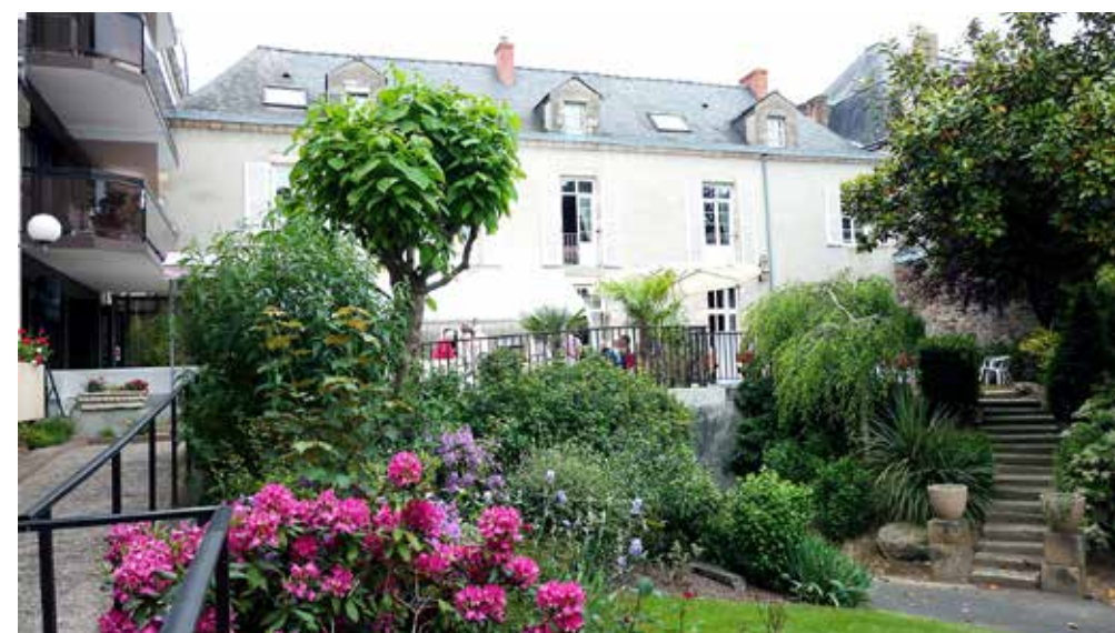
Les résidents profitent d'un parc arboré de 4 000 m 2 .

Résidence services Foch 13 avenue du Maréchal-Foch à Cholet Tél.: 02 41 65 46 70 - contact@residence-foch.fr www.residence-foch.fr