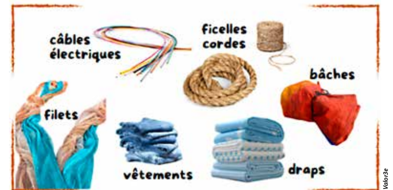
Pour éviter la formation de torons, ces déchets sont à apporter en déchèterie ou point de collecte.

Point info famille Pôle social Germaine-Heulin 24 avenue Maudet à Cholet Tél.: 02 72 77 22 10 info-famille@choletagglomeration.fr Prévoir maillot de bain et serviette pour chacun