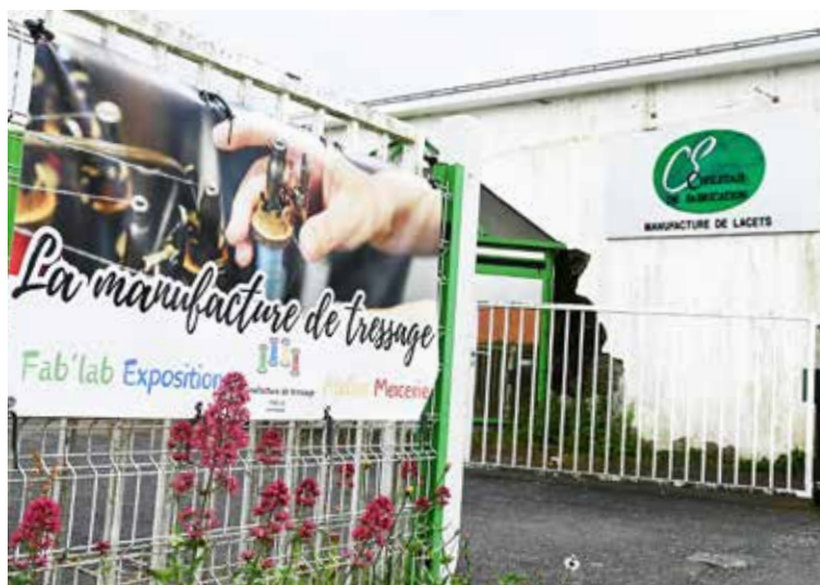
La nouvelle identité du lieu, devenu Manufacture de tressage, cohabite avec l'ancienne, usine de fabrication de lacets.

Les métiers à tresser en bois peuvent être actionnés avec une manivelle ou tourner grâce à un moteur. Ils se travaillent dès quatre fuseaux, et jusqu'à 120 par machine.