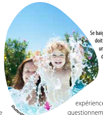
Se baigner doit rester un moment de plaisir.

Parce qu'échanger peut offrir les réponses à des interrogations ou simplement rassurer, le Point info famille propose, chaque mois, les Rendez-vous des parents. Des temps pour se poser, s'informer et partager. Le samedi 29 juin, les parents d'enfants de 3 à 7 ans sont invités, avec leurs petits, au centre de loisirs Prim'Vert, à l'étang des Noues, pour un atelier un peu particulier: un moment de baignade, dans la piscine du site, encadré par les maîtres-nageurs de Glisséo (à 9 h pour les 3-5 ans et à 10 h 30 pour les 5-7 ans). Accompagner son enfant dans le milieu aquatique est en effet une étape importante. La baignade doit rester un plaisir, à condition de respecter quelques consignes. Les parents sont les premiers acteurs de ce bien-être partagé. À la veille des vacances d'été, ils pourront donc échanger sur leurs