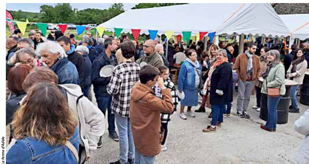
La ferme d'Idèle