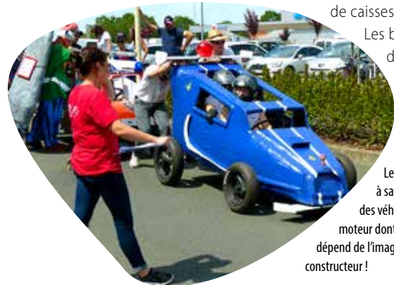
Les caisses à savon sont des véhicules sans moteur dont la conception dépend de l'imagination de son constructeur !

Le lendemain, le Comité loisirs et animations maulévrais prend le relais, avec la 4 e édition des courses de caisses à savon.