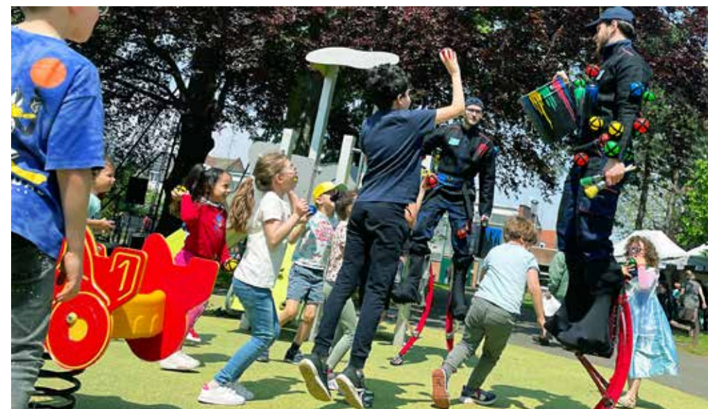
Les enfants pourront tenter d'accrocher des balles sur Graff et Scratch montés sur leurs échasses.

Ludothèque du Choletais 30 rue Bretonnaise, Arcades Rougé à Cholet Tél.: 02 72 77 23 44 ludothèque@choletagglomeration.fr https://ludothèque.cholet.fr/