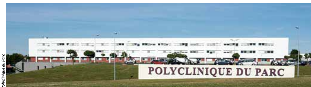
La polyclinique va prochainement fermer sa maternité, mais poursuivra le suivi de grossesse et les consultations gynécologiques classiques. L'équipe de professionnels projettera, par ailleurs, de développer son activité chirurgicale gynécologique, cancérologique pelvienne et sénologique.

Le service obstétrical de la polyclinique du Parc doit fermer ses portes à l'automne, ne devenant plus qu'un avec celui du centre hospitalier, pour une offre de soins optimale.