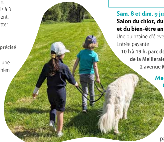
La Bonne patte

Infos au 06 43 14 51 26 ou labonnepatte49@gmail.com Inscription obligatoire : https://labonnepatte49.wixsite.com/labonnepatte