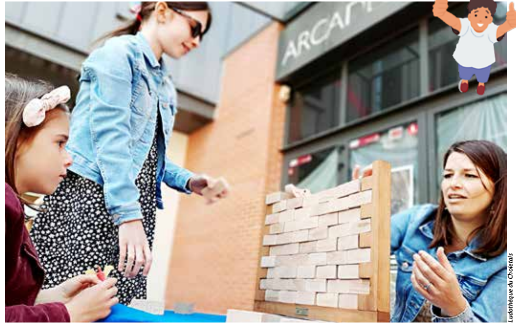
Petits et grands partagent toujours un délicieux moment à la Piste des jeux.

À ne pas manquer également: un jeu de fléchettes géant et un speed game. Le principe? Chaque joueur possède une couleur et