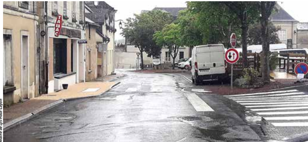
Mairie de Lys-Haut-Layon

Afin de rendre plus sûr l'accès entre le commerce la Petite pause et la place d'Armes, la voirie a été adaptée à la faveur de quelques semaines de travaux. Explications.