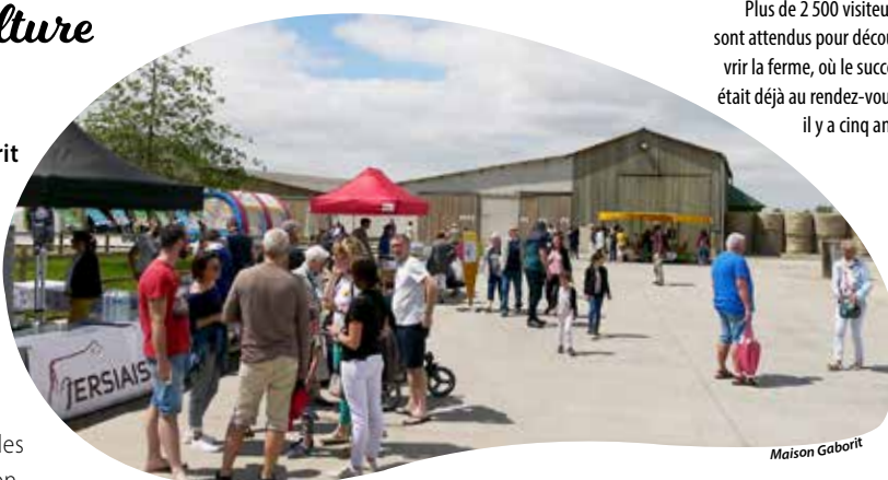
Plus de 2 500 visiteurs sont attendus pour découvrir la ferme, où le succès était déjà au rendez-vous, il y a cinq ans.

Des animations pour tous Familial et convivial, c'est comme cela que le programme est élaboré, avec au menu : visites de la ferme et traite des vaches, découverte des métiers, ateliers de toutes sortes, expositions sur l'eau, le climat et le réemploi, marché regroupant une vingtaine de producteurs bio et artisans locaux (maraîchage, confiture,