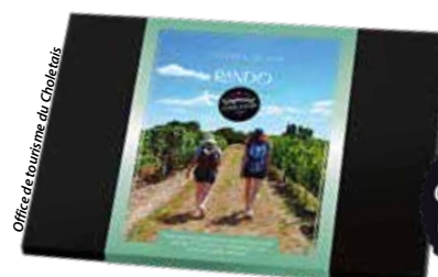
Le coffret Rando permet, entre autres, de découvrir les sentiers du Choletais.

Tarif coffret Rando : 189 € pour deux personnes