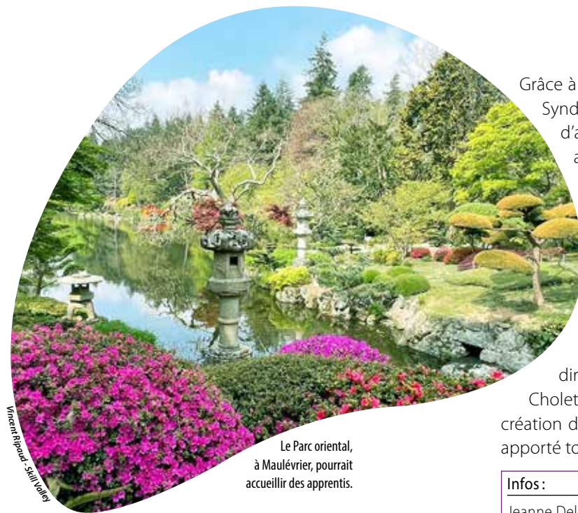
Le Parc oriental, à Maulévrier, pourrait accueillir des apprentis.