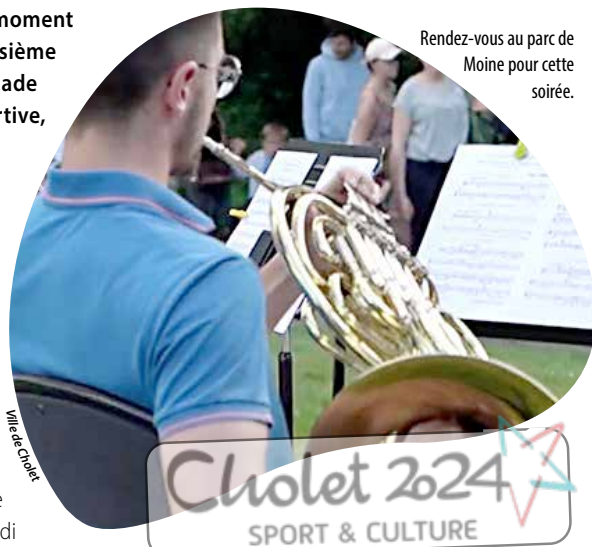
Rendez-vous au parc de Moine pour cette soirée.

Invitation à un moment convivial, la troisième édition de la Balade musicale et sportive, organisée par la direction des Sports de la Ville de Cholet, s'inscrit cette année dans le cadre du label Cholet 2024 Sport & Culture. Rendez-vous est donc donné au parc de Moine, ce vendredi 7 juin, de 19h à 22h, aussi bien aux mélomanes qu'aux athlètes novices ou confirmés. Autour des élèves du conservatoire du Choletais – le Big band et les percussions trompettes installés à la Pergola (ouverte pour l'occasion) et les Musiques amplifiées et improvisées sur l'île au niveau du petit théâtre, seront proposés cinq espaces sportifs : tennis de table, badminton, slack