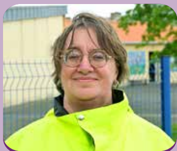
« Bien identifiée avec ma tenue réfléchissante et mon panneau stop, je sécurise les déplacements de piétons. »