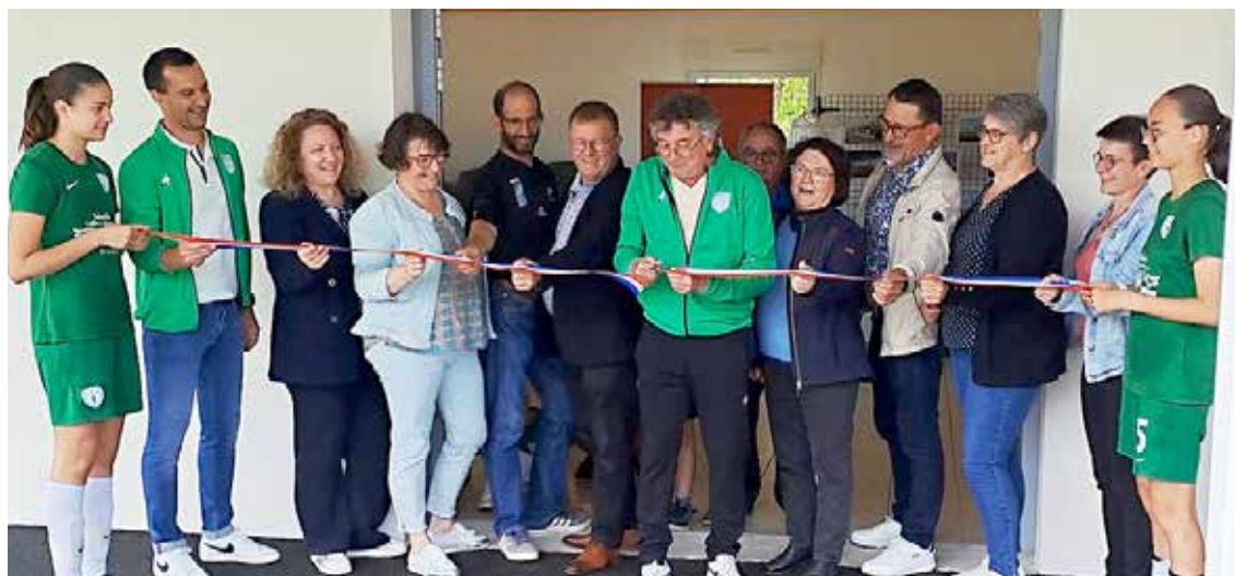
Mairie de Montilliers

Après pratiquement un an de travaux pour réhabiliter les anciens vestiaires en club-house, celui-ci vient d'être inauguré, notamment en présence d'élus municipaux, de membres de l'Espérance sportive de Montilliers (ESM), de maires voisins et d'un représentant du district. L'ESM dispose désormais d'une salle de réception d'environ 90 m 2 juxtaposée à la nouvelle buvette. Une salle de réunion et un bureau ont également été aménagés pour répondre aux besoins des responsables techniques, éducatifs et sportifs. Tout cela dans un souci d'optimiser l'attractivité du club et de développer le « mieux vivre ensemble », selon les mots du maire, Philippe Bernard.