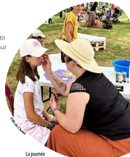
La journée de clôture offre une multitude d'animations.

De 14 h à 17 h 30 La ludothèque, le service petite enfance et le relais petite enfance réunissent jeux en bois au format XXL, jeux d'adresse et autres surprises à partager en famille.