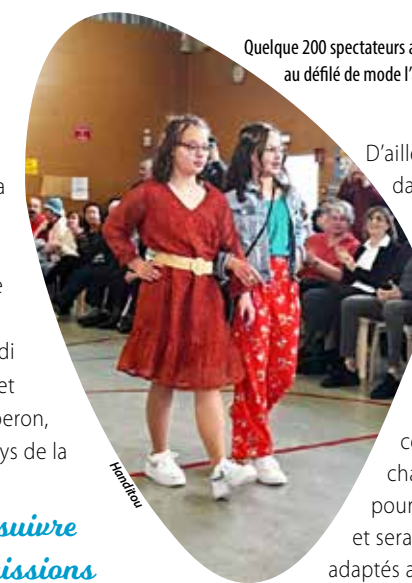
Quelque 200 spectateurs avaient assisté au défilé de mode l'an dernier.

Les bénéficiaires de cette journée participeront à financer les activités de l'association (jeu, chant, peinture, cuisine, sorties...), toutes pensées pour briser l'isolement, créer des liens amicaux et (re)donner espoir.