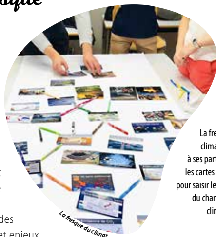
La fresque du climat donne à ses participants les cartes en main pour saisir les enjeux du changement climatique.

Le samedi 22 juin prochain, l'association Ça commence par nous organise un atelier fresque du climat. Ce temps collaboratif, ludique et grand public permet de comprendre collectivement et de s'approprier l'essentiel des causes, conséquences et enjeux du changement climatique. Animé par des bénévoles, ce rendez-vous gratuit se tient dans la salle de la rue Henri-Alliot, de 9 h 30 à 12 h 30. Il est nécessaire de s'inscrire préalablement pour y participer.