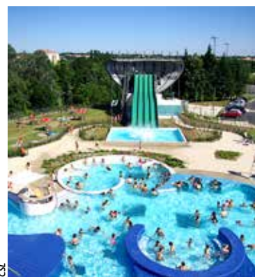
Les espaces extérieurs de Glisséo ouvrent le samedi 8 juin.

Les beaux jours sont de retour et avec eux, l'ouverture de l'espace extérieur de Glisséo! À partir de ce samedi 8 juin, les amateurs peuvent profiter du bassin ludique de 500 m 2 , du pentagliss et des plages. Jusqu'au vendredi 28 juin et du lundi 2 au dimanche 15 septembre, l'espace est accessible les lundis, mardis, jeudis et vendredis, à partir de 17h (à l'exception du pentagliss, dont l'accès est fermé pendant cette période), les mercredis et samedis, de 15h à 18h et le dimanche, de 9h à 13h et de 15h à 18h.