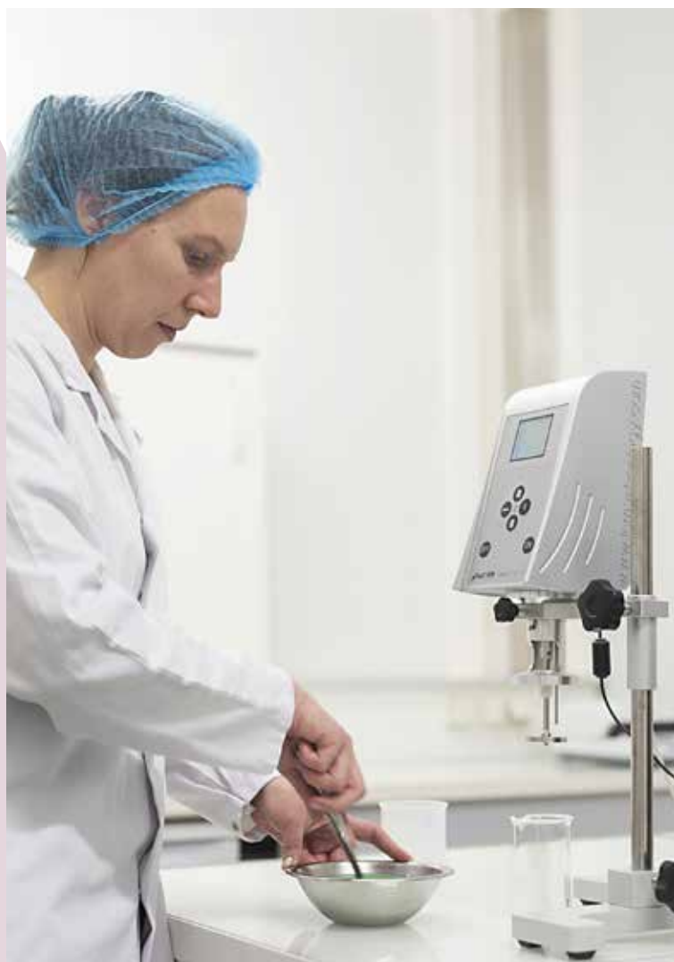
Cyranie maîtrise l'intégralité de sa chaîne de production, de la recherche et développement jusqu'à l'expédition, en passant par la fabrication, le conditionnement et la vente en direct avec ses commerciaux.