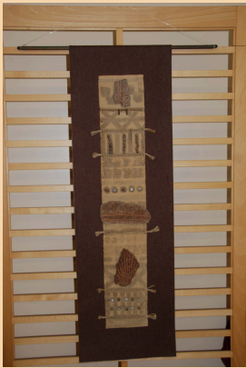
Exposition "Empreintes boisées" d'Aurore Bussereau