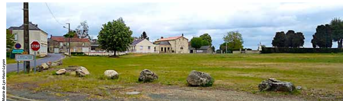
Mairie de Lys-Haut-Layon

Ce terrain, situé face à l'entrée de la commune, était occupé il y a quelques années par un abattoir, dont tous les bâtiments ont été rasés. Aujourd'hui transformé, il accueille des circuits de BMX et fait l'objet d'un projet de végétalisation sur l'espace disponible.