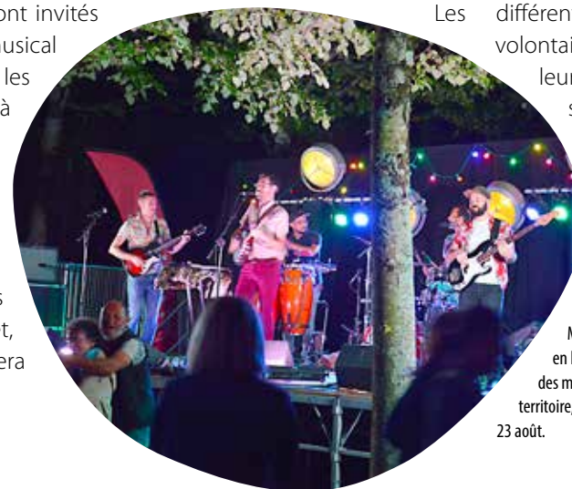
La scène de la guinguette du Mail va mettre en lumière des musiciens du territoire, le vendredi 23 août.

quant à elle la part belle aux artistes prêts à jouer un, deux, trois morceaux ou plus, qu'ils interpréteront peut-être pour la première fois devant un public.