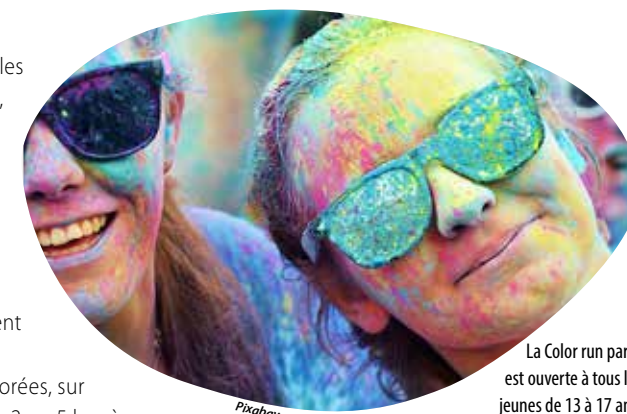
La Color run party est ouverte à tous les jeunes de 13 à 17 ans.

En binôme, les participants, invités à se déguiser pour ceux qui le souhaitent, seront copieusement aspergés de poudres colorées, sur un circuit de 2 ou 5 km, à réaliser en courant... ou en marchant. L'objectif, au-delà du défi sportif, étant surtout de s'amuser!