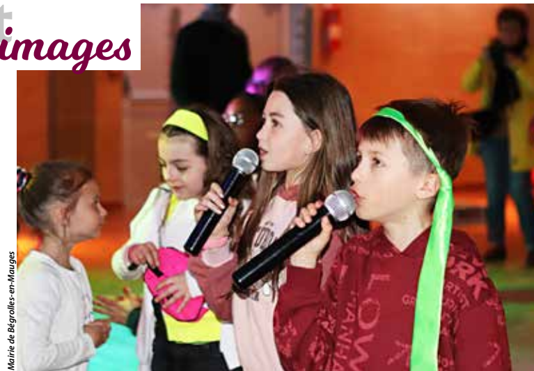
Du mercredi 3 au dimanche 7 avril Nuaillé, Cholet et Bégrolles-en-Mauges