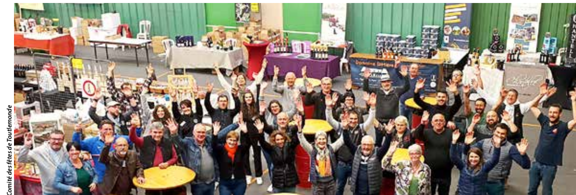
Comité des fêtes de Toutlemonde

Les exposants sont, pour la plupart, des fidèles depuis la première édition.