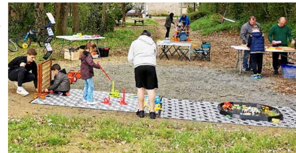
Le Coin de la rue

Dans le cadre des actions « Et si on regardait les écrans autrement ? » organisées par le centre socioculturel Le Coin de la rue et les acteurs éducatifs du territoire, les enfants étaient invités, juste après l'école, à investir la rue ou un espace adapté, comme ici, à la Motte féodale. Jeux de société aux formats classique et géant ou parcours de motricité leur ont permis de s'amuser pour terminer leur journée entre copains, loin des écrans ! D'autres animations (soirées, conférences, ateliers...) sont encore proposées jusqu'au mardi 14 mai (lire p. 20).