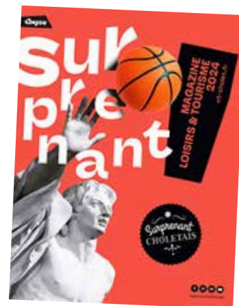
Le nouveau magazine Surprenant Choletais est disponible !

Évidemment, l'équipe Surprenant Choletais distille aussi quotidiennement ses conseils sur