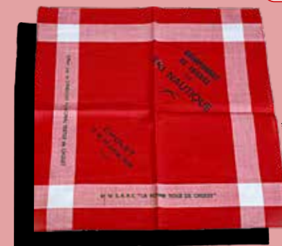
Mouchoir, 1970 Coton tissé teint sérigraphié en noir N° inventaire : 2023.015.2 Collection musée du Textile et de la Mode

Ce même été, les stars du ski nautique envahissent le lac de Ribou pour le championnat de