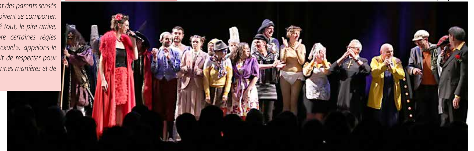
Les Impromptus 2023

Les Joyeux lurons (Cholet) Brigands Un metteur en scène despotique tente de monter une adaptation loufoque de l'opérette Les brigands avec une équipe loin d'être acquise à son projet! Cet impromptu revisite cette opérette de 1869 en trois actes, de Jacques Offenbach.