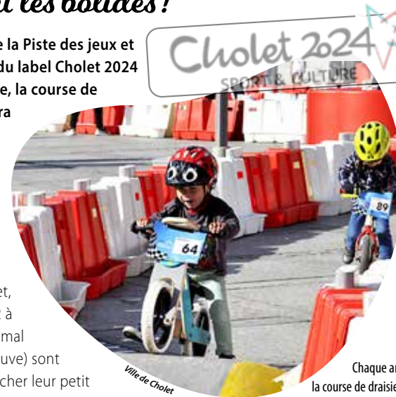
Chaque année, la course de draisienne fait le plein!

Encadrés par la direction des Sports de la Ville de Cholet, les enfants de 2 à 5 ans (âge maximal le jour de l'épreuve) sont invités à enfourcher leur petit bolide, pour quatre courses, par catégorie, sur un parcours de 350 m entièrement sécurisé. Après l'accueil et la découverte de ce circuit, de 9 h 15 à 10 h, les séries et phases finales se dérouleront de 10 h à 12 h 30. Les jeunes participants doivent apporter: leur dossard, leur propre draisienne, leur casque, des vêtements longs, gants, chaussures fermées et chaussettes hautes. Cette animation, gratuite, est limitée à 100 petits pilotes, qui recevront tous une surprise.