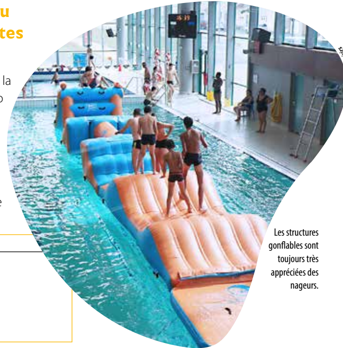
Les structures gonflables sont toujours très appréciées des nageurs.

Glisséo Avenue Anatole-Manceau à Cholet Tél.: 02 41 71 64 20 info@glisseo.com Tarif: entrée piscine ou patinoire