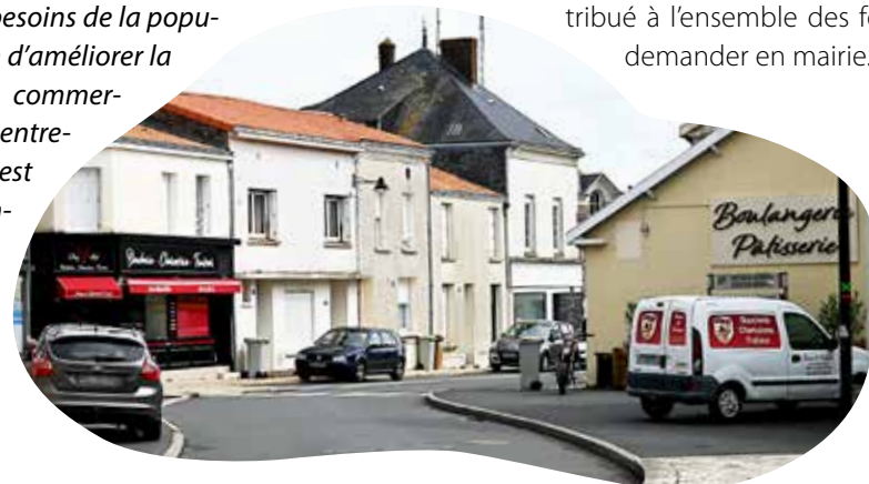
Rue de l'Abb  Dup  comme ailleurs dans la commune, les commerces et services de proximit  jouent un r le essentiel.