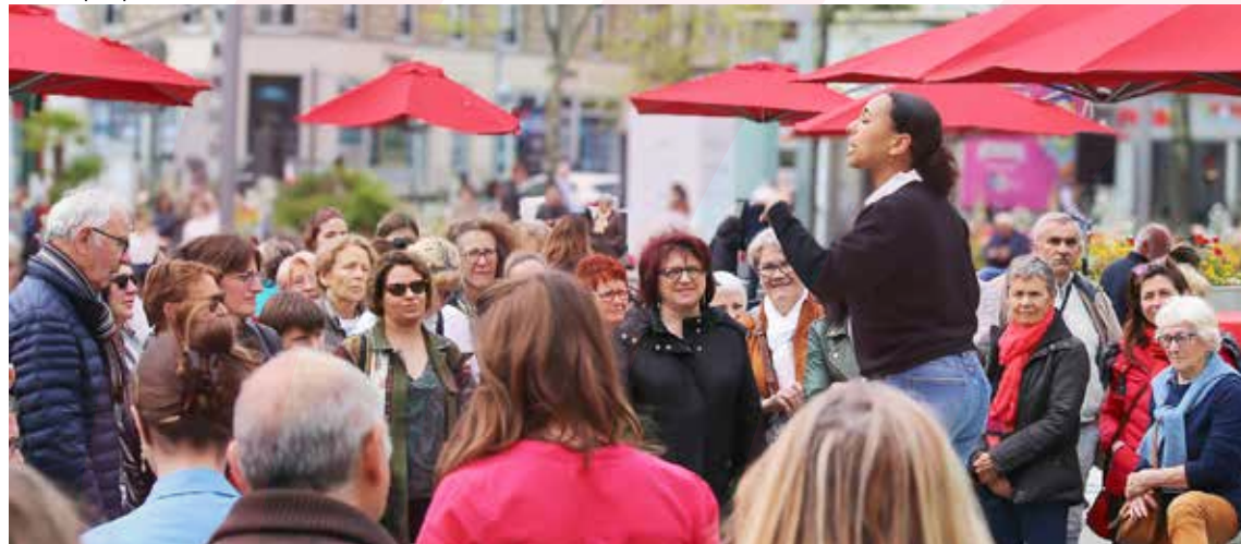
Fête de la pratique amateur 2023

Un temps fort pour valoriser la pratique artistique et culturelle amateur du Choletais, avec : la Baraque à cirque, le chœur d'hommes Expression (chants), Danse et vie (danse, sport et bien-être), Ginga Nago Capoeira, Go Live Trio (chanson française), JF Danse, Karaté athlétique choletais, la Fabrique chorégraphique (danse), les Z'Improbables (théâtre d'improvisation).